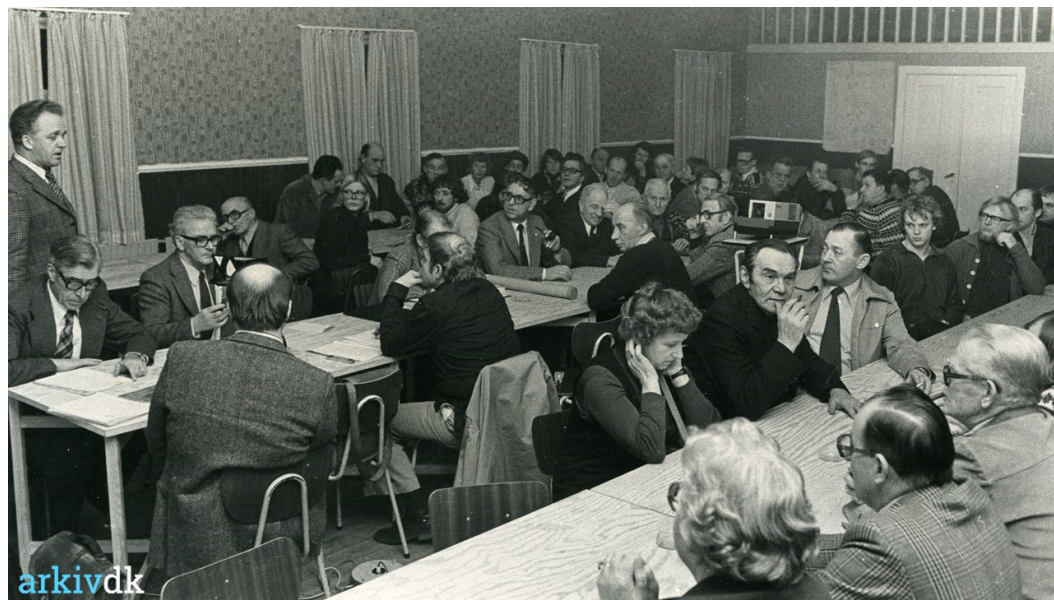
Borgermøde om byplan i Skovby Forsamlingshus. 1977.

Skovby Borgerforening • eg@handigood.dk • Tlf. 40607273