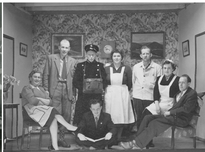
Til venstre: Opførelse af en sketch (1950), til højre dilettantforestilling (1955).